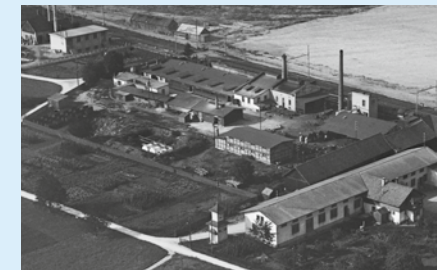
Flugbild 1924 mit ehem. Dachpappi /CTW sowie Fass- und Sauerkrautfabrik Haass.

Der Rundgang gibt Einblick in die Zeit der Industrialisierung vom Ende des 19. bis Mitte des 20. Jahrhunderts, von der Dalang-Teigwarenfabrik zum Beton-Christen, weiter zum Pantheon und zur Florin AG bis zur Fass- und Sauerkrautfabrik Haass.