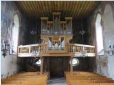
Blick auf Westwand mit Orgel und Jüngstem Gericht.

Die Wehrkirche St. Arbogast ist das einzige Gotteshaus in der Schweiz, welches von einer fast kreisförmigen Ringmauer ganz umschlossen ist. Sehenswert sind auch die Fresken aus dem 15. und 16. Jahrhundert im Inneren der Kirche und im Beinhaus, sowie die Grenzsteinsammlung im ehemaligen Friedhof.