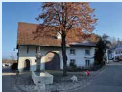
Burggasse Nr. 9.

Der Rundgang zeigt die wichtigsten Häuser im Bereich Oberdorf, Gempengasse, Burggasse, Geispelgasse und Baselstrasse.