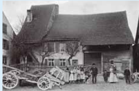
Das älteste Bauernhaus, Hauptstrasse 23/25.

Der Rundgang zeigt die wichtigsten Häuser in der Hauptstrasse und am Kirchplatz.