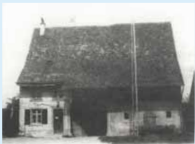
Ehemals Hauptstrasse 15.

In Muttenz sind in Laufe der Zeit einige alte Bauernhäuser abgerissen worden und somit verschwunden. Der Walk besucht die ehemaligen Standorte dieser Bauernhäuser. Wir zeigen dort Bilder dieser Bauernhöfe und geben Infos dazu.