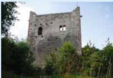
Mittlere Ruine Wartenberg.

MuttENZ besitzt einen reichen Schatz an Sagen, so findet man auf diesem Weg unter anderem die Sage vom Heiligen Arbogast, vom Schädel aus dem Beinhaus sowie vom Schatzgräber auf dem Wartenberg. Der gesamte Rundgang ist knapp 9 km lang, kann aber auch aufgeteilt werden.