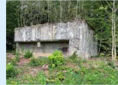
Bunker auf der Rütihard.

Der Rundgang entlang der Befestigungslinie des 2. Weltkriegs zeigt die Vorbereitungen und Überlegungen zur Verteidigung in jenen bedrohlichen Jahren. Mit Zitaten aus der Zeit.